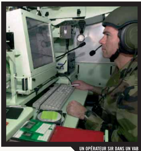
UN OPÉRATEUR SIR DANS UN VAB

Depuis le 21 avril 2004, le centre de simulation et d'entraînement au commandement opérationnel constitue le cœur de la formation tactique de l'école d'application de l'infanterie. Installé dans le nouveau bâtiment d'instruction "LEMATTRE", il est l'outil principal de formation tactique des chefs de corps, des commandants d'unité ainsi que des adjoints techniques d'unités élémentaires. Il permet en outre la formation et l'entraînement du personnel des régiments numérisés dans un environnement tactique de commandement interarmes dans des conditions réalistes.