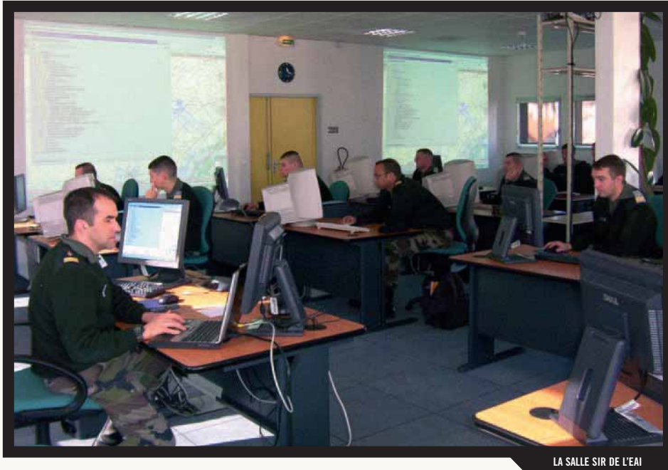
LA SALLE SIR DE L'EAI

Depuis le 21 avril 2004, le centre de simulation et d'entraînement au commandement opérationnel constitue le cœur de la formation tactique de l'école d'application de l'infanterie. Installé dans le nouveau bâtiment d'instruction "LEMATTRE", il est l'outil principal de formation tactique des chefs de corps, des commandants d'unité ainsi que des adjoints techniques d'unités élémentaires. Il permet en outre la formation et l'entraînement du personnel des régiments numérisés dans un environnement tactique de commandement interarmes dans des conditions réalistes.