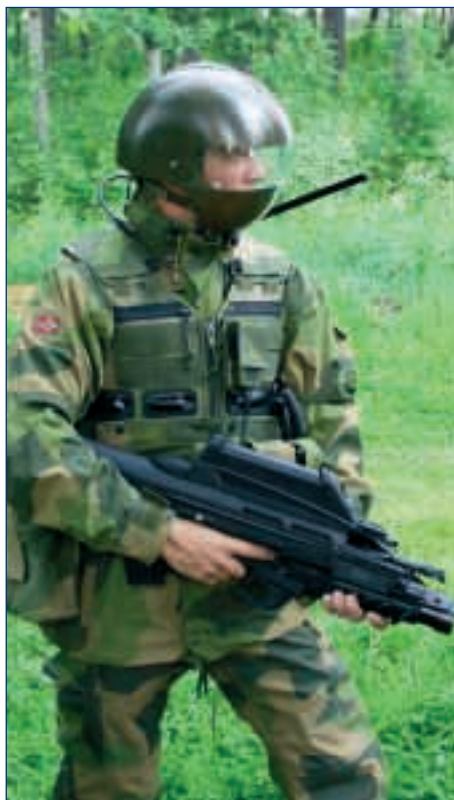
▲ NORMANS (Norvège)

With its FELIN programme, France belongs to the first category. It may thus prove interesting to stress the differences and similarities of its contenders. This study will focus on the main programmes, namely, FELIN (France), Land-Warrior (USA), IdZ (Germany), FIST (United Kingdom), NORMANS (Norway), COMFUT (Spain), and ISSP (Canada).